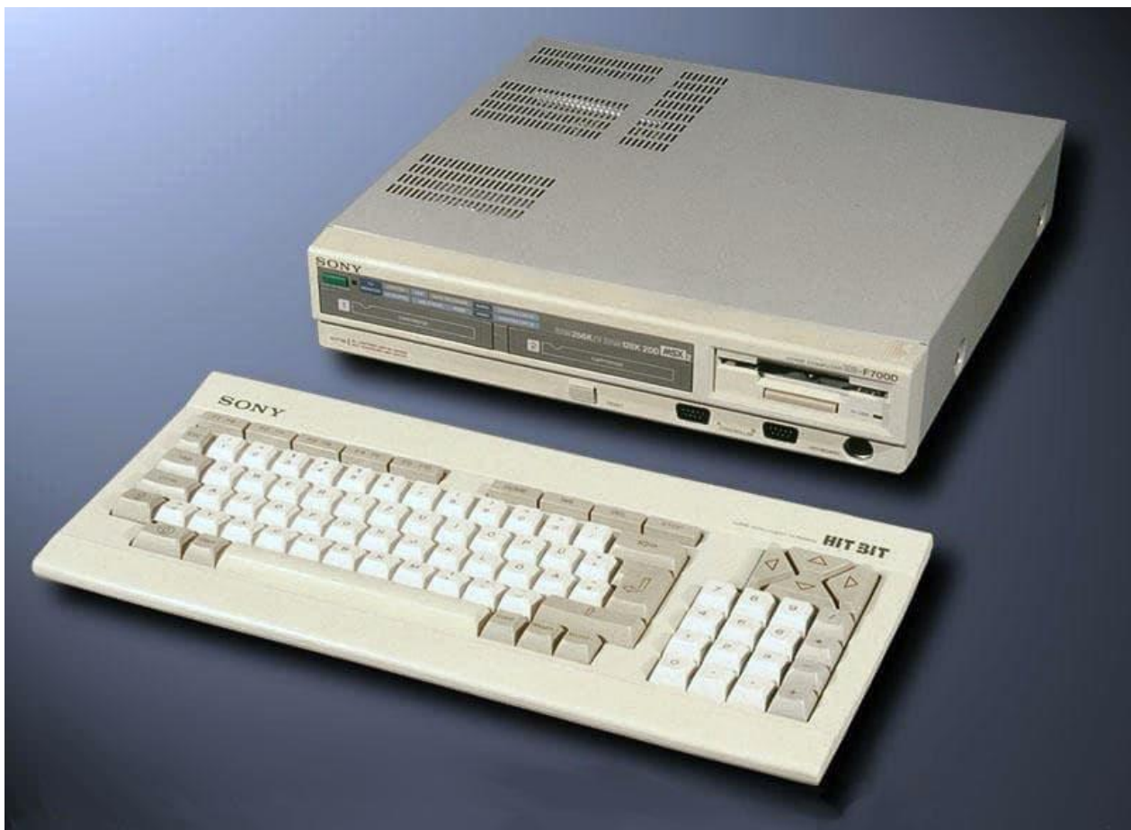
De Sony HB-F700P/D MSX-2 computer.